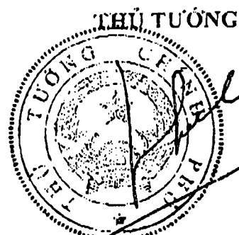
Nguyễn Xuân Phúc